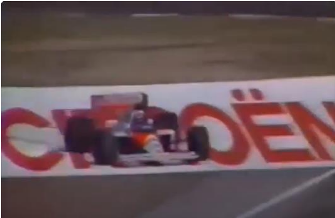
Jornal O Estado de São Paulo 06/11/1996 pg 36.

No GP San Marino 89, Prost cortou a chicane na volta 45, mas não foi punido. Se fosse seguir o critério da punição de Senna no GP Japão 89, o francês deveria ter sido punido.