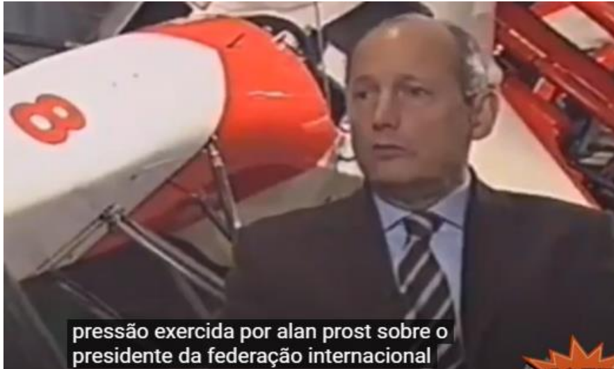
Imagem reproduzida do vídeo da entrevista de Ron Dennis sobre Prost no Japão 1989. Fonte: https://www.youtube.com/watch?v=nfE8uoolr0

Anos mais tarde, Ron Dennis confirmou em entrevista em vídeo, que Prost pressionou Balestre para manipular o resultado do GP Japão 1989.