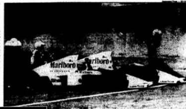
Depois do choque com Williams, em 89, no Japão, Prost não desistiu e venceu para seu amigo por um segundo ano consecutivo.

MILAN/REUTERS Ayrton Senna, com três títulos mundiais, não se dá por vencido. O piloto brasileiro admite ter ajudado Prost contra Senna no GP do Japão em 1989, mas afirma que não se dá por vencido. Senna diz que não se dá por vencido e que não se dá por vencido.