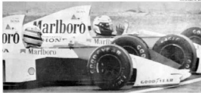
O auge da tensão. Senna e Prost colidem numa chicane no GP do Japão, na polêmica decisão do título de 1989

— Pela primeira vez eu vi Alain tenso. Ele havia alcançado o status de número um na equipe e, de repente, havia um jovem que tinha total noção do que era ser competitivo — lembrou o chefe da