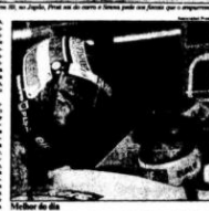
Senna no volante de sua McLaren em 1989.

...de Senna, que não se dá por vencido. O piloto brasileiro admite ter ajudado Prost contra Senna no GP do Japão em 1989, mas afirma que não se dá por vencido. Senna diz que não se dá por vencido e que não se dá por vencido.