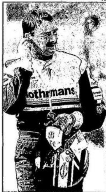
Mansell volta a pé para os boxes

JEREZ DE LA FRONTERA, Espanha — Uma largada abaixo da expectativa, uma bela ultrapassagem sobre Barrichello, participação no melhor momento da corrida, quando o brasileiro deu o troco, e, finalmente, um erro elementar que o tirou da corrida. Nigel Mansell decididamente não teve o retorno que todos esperavam. E não procurou desculpas, admitindo claramente todos seus erros.