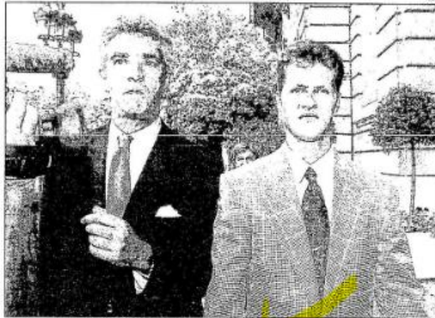
Schumacher (à direita) chega para a reunião na FIA, em Paris, com Flavio Briatore, diretor esportivo da Benetton

— Estou profundamente desapontado. Acho a suspensão injusta — afirmou o piloto, acrescentando que estava abalado.