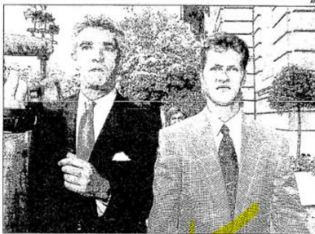
Schumacher (à direita) chega para a reunião na FIA, em Paris, com Flavio Briatore, diretor esportivo da Benetton

— Estou profundamente desapontado. Acho a suspensão injusta — afirmou o piloto, acrescentando que estava abale-