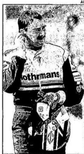
Mansell volta a pé para os boxes

JEREZ DE LA FRONTERA, Espanha — Uma largada abaixo da expectativa, uma bela ultrapassagem sobre Barrichello, participação no melhor momento da corrida, quando o brasileiro deu o troco, e, finalmente, um erro elementar que o tirou da corrida. Nigel Mansell decididamente não teve o retorno que todos esperavam. E não procurou desculpas, admitindo claramente todos seus erros.