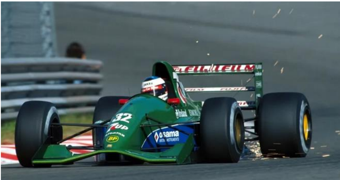
Foto do bico alto da Jordan 1991, com o mesmo conceito do Bico da Tyrrell 1990. O objetivo desse bico era impulsionar o ar para baixo do carro e fazê-lo percorrer o assoalho o mais rápido possível para gerar downforce com o mínimo de arrasto aerodinâmico. Esse conceito foi usado pela Benetton Tubarão.

Nesse ano a Jordan estreou na F1 vindo da F3000, seu carro foi desenhado pelo irlandês Gary Anderson. A Jordan tinha o mesmo conceito do Tyrrell 90, ou seja, nariz ligeiramente alto, para direcionar o ar para baixo do assoalho e gerar downforce no carro. A Jordan foi o 5º melhor carro da F1 em 1991.